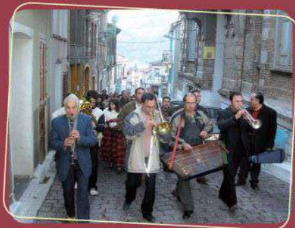
Πατινάδα με την παραδοσιακή κομπανία του Αναγνωστηρίου