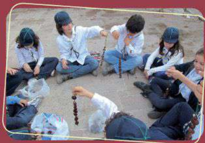
Παιχνίδια με κάστανά από το Σώμα Ελληνικού Οδηγισμού