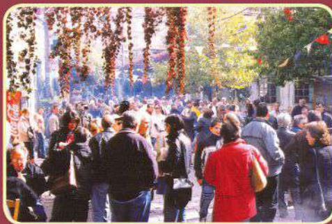
Κατάμεστη από κόσμο η Πλατεία Αγοράς