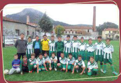
Η ομάδα του Α.Π.Σ. Αγιάσου «Αναγέννηση»