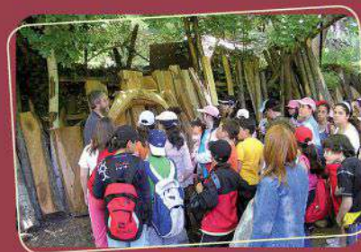
Φιλοξενία Σχολείου από το Κέντρο Περιβαλλοντικής Εκπαίδευσης Ευεργέτουλα