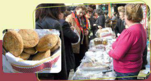
Καστανόψωμα και άλλα προϊόντα του κάστανου στον πάγκο του Συνεταιρισμού Γυναικών