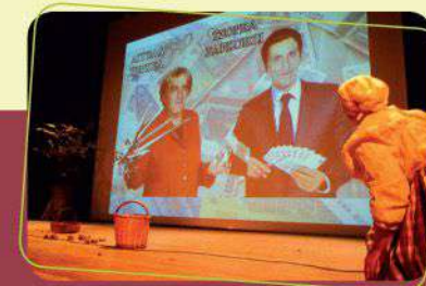
Επίκαιρα σατιρικά θεατρικά μονόπρακτα

Στο Σταυρί, στην Πλατεία Δημαρχείου και σε άλλους χώρους το Σώμα Ελληνικού Οδηγισμού (ΣΕΟ) θα οργανώσει παιχνίδια για τους μικρούς μας φίλους.