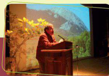
Ομιλίες - παρουσιάσεις με θέματα σχετικά με τον καστανιάνα